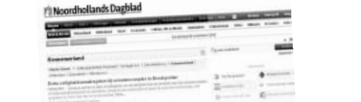
Lezers die op de website hebben gereageerd op artikelen, komen hier aan het woord.

Poppodium Donkey in Heemskerk eindigde met een enorm tekort door gebrek aan toezicht, blijkt uit onderzoek.